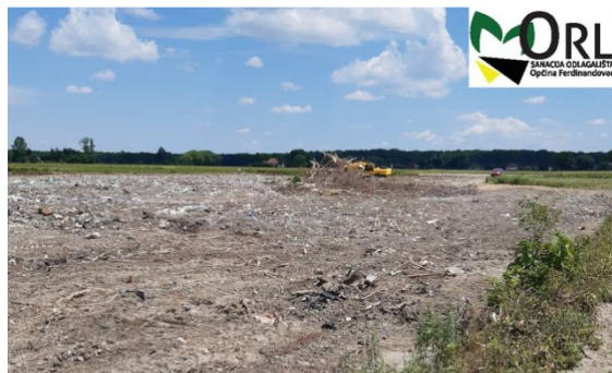
Slika 3.: Sanacija odlagališta Orl Ferdinandovac

izvedbu temeljnog brtvenog (atenuacijskog) sloja, konačnu ugradnju otpada na temeljni brtveni sustav prema projektom definiranoj geometriji, prekrivanje preoblikovanog otpada završnim prekrivnim sustavom, izgradnju sustava za prikupljanje i odvodnju oborinskih voda, izgradnju sustava za otplinjavanje, izgradnju obodne servisne prometnice, izgradnju ograde oko prostora odlagališta i ulaznih vrata te krajobrazno uređenje prostora odlagališta.